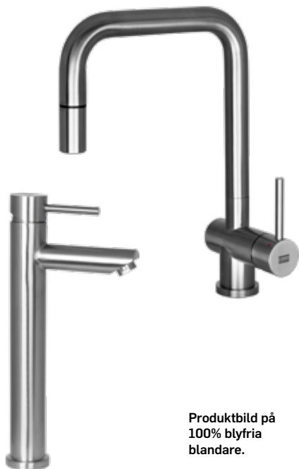
Produktbild på 100% blyfria blandare.

Resonemanget bakom kallstarten är att tekniken hjälper oss att minska vårt slöseri genom att tvinga oss att göra ett aktivt val för att få fram ledning av varmt vatten. På Arlanda har de exempelvis fått ner energianvändningen för tappvarmvatten med 60