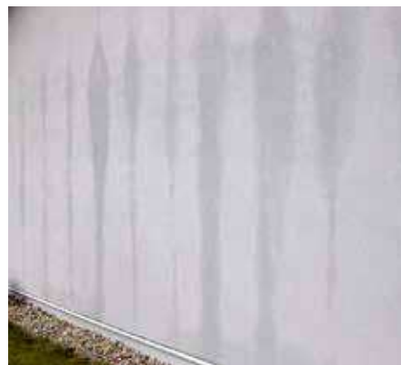
Bild 2: Putsad fasad med missfärgningar vid vertikal träläkt i luftspalten. Träläkten har sugit upp vätska från MOC-skivan samt fuktat upp och missfärgat putsbäranen.

Under 2010 rapporterades sprickor i kaklet i badrum med MOC-skivor. Sannolikt bidrog det att MOC-skivorna hanterades som om de var helt okänsliga för fukt. Pallarna med liggande skivor lagrades utomhus på byggarbetsplatsen utan väderskydd och skivorna var fortfarande blöta då de monterades.