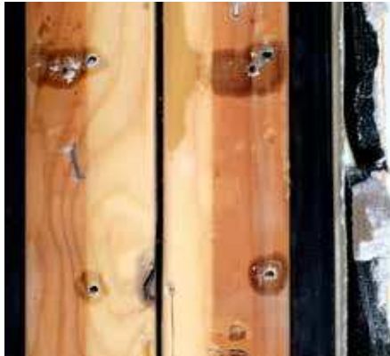
Bild 4: Träregelstomme som fuktats upp lokalt vid skruvhål till infästning av MOC-skiva.

ningar på sockeln. De uppstod under natten och observerades på morgonen, ofta försvann missfärgningarna under dagen och kunde vara borta i flera dagar innan de eventuellt återkom igen. Det första intrycket var att fasaden läckte in vatten som sedan rann ut genom nederkant av luftspalten. Ofta skedde "läckaget" inom ett begränsat område på en eller två sidor av byggnaden.