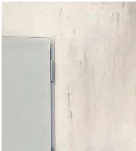
Bild 8: Putsad fasad med missfärgning av mikrobiell påväxt hos träfraktioner i MOC-skivan som felaktigt använts som putsbärare.