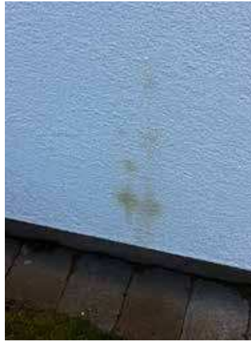
Bild 6: Brun missfärgning av korrosionsprodukter från infästningsskruvar, med lågt korrosionsskydd, i kontakt med fuktig eller blöt MgO-skiva.

tade delen av träet. Det finns inte någon påväxt närmast MOC-skivan där det kan förväntas vara fuktigast vilket tyder på att salterna från MOC-skivan kan antas ha en hämmande effekt på den mikrobiella påväxten.