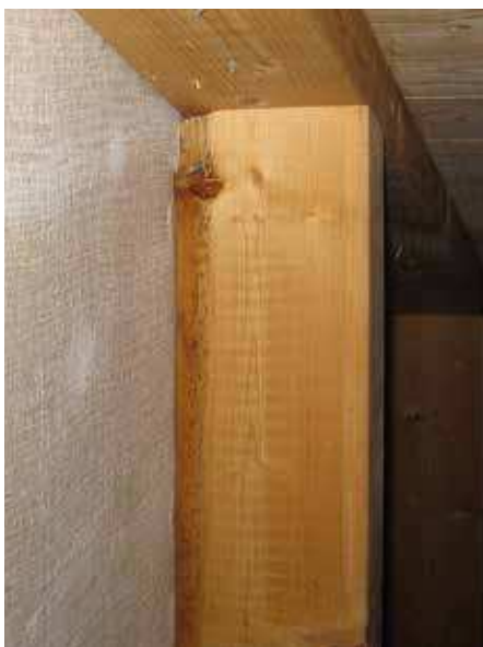
Bild 5: Svarta prickar av mikrobiell påväxt på träregelstomme i kontakt med MOC-skiva.

Sannolikt spelar gradienten av fukt och insugna salter en avgörande roll eftersom den synliga mikrobiella påväxten begränsas till ett smalt område längs med det uppfuk-