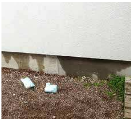
Bild 1: Väska från MOC-skivor har runnit ut genom luftspaltens öppning och missfärgat husets sockel.

Med ökad kunskap om materialet och med rätt kvalitetskontroll så har MgO-skivorna sannolikt klarat ut sina barnsjukdomar. Ingenting tyder än så länge på att delikvescens kan uppträda på den nya typen av