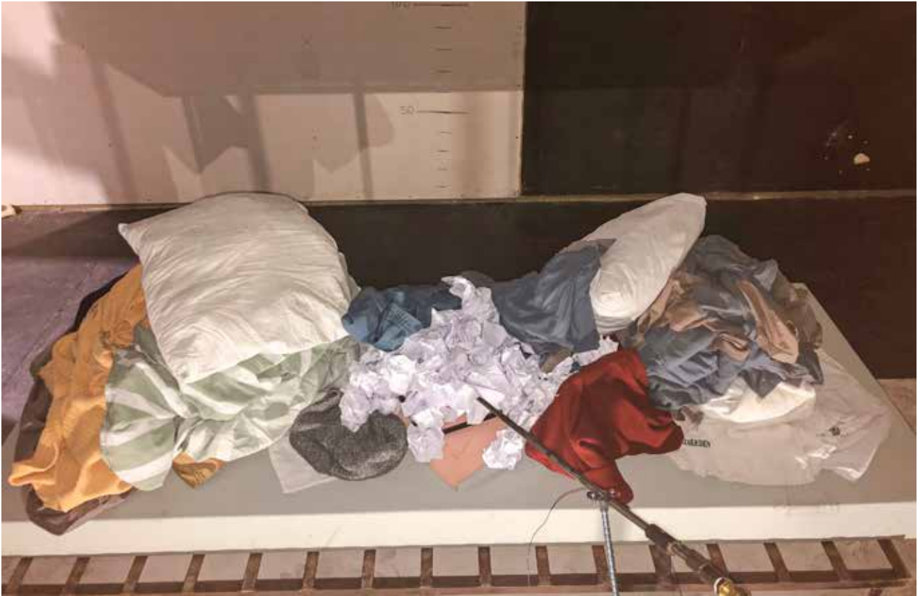
Figur 1. Kriminalvårdens branduppställning.

→ ringen tas det då hänsyn till att spridning inte ska ske på frånluftssidan.