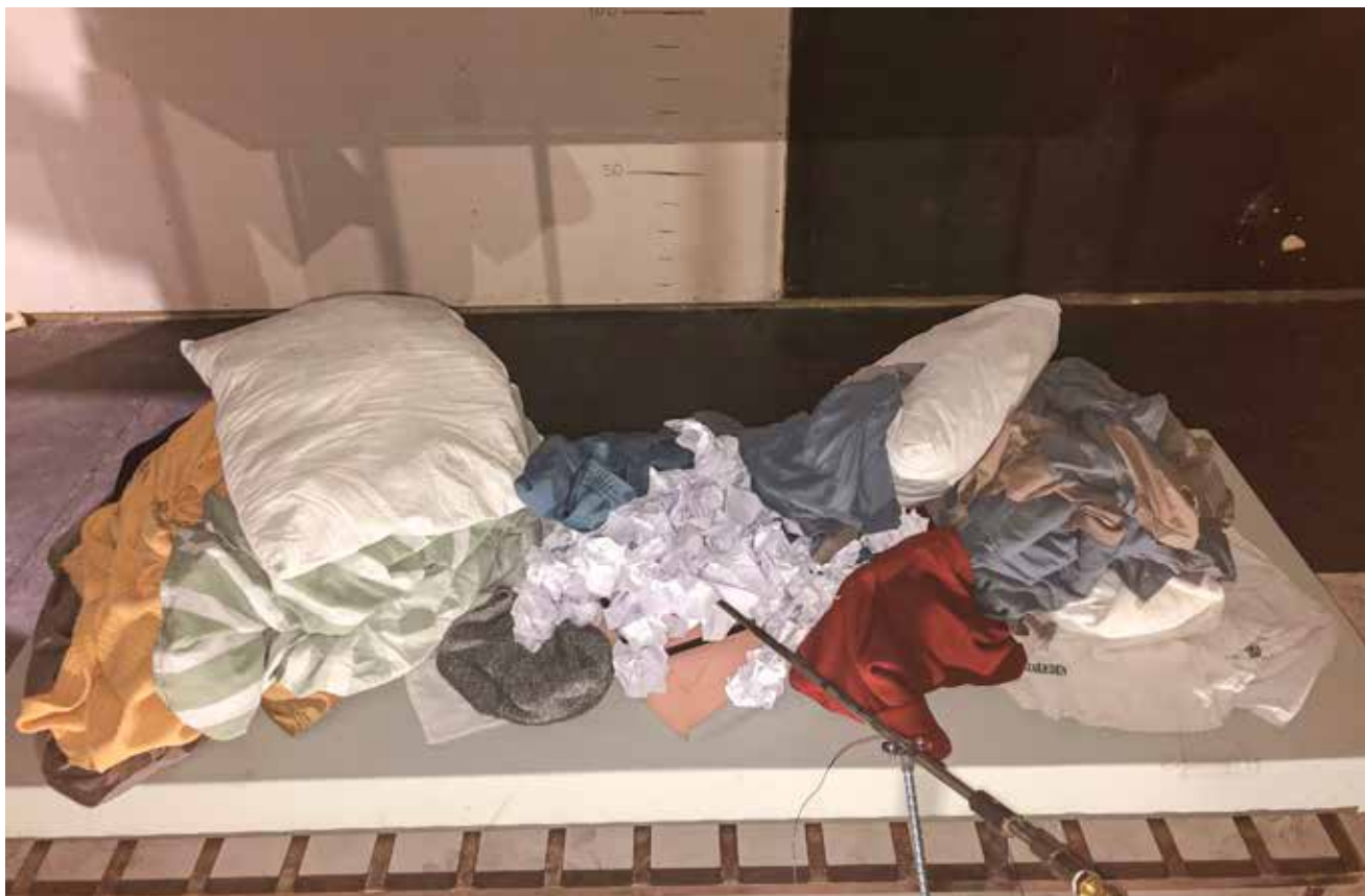
Figur 1. Kriminalvårdens branduppställning.

→ ringen tas det då hänsyn till att spridning inte ska ske på frånluftssidan.