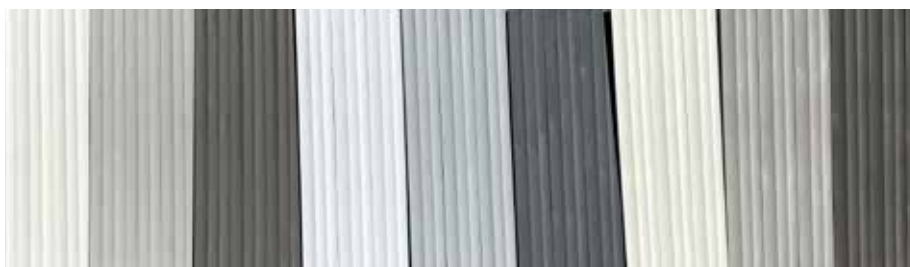
Olika varianter på ytskiktets bearbetning och ytbehandling har utvärderats i projektet.

Arkitektens ritningar skickades digitalt till hyvleriet som bearbetade panelernas yta och kanter samt läkten. Vi tog fram ett flertal varianter på ytmönster förberedda för olika kombinationer, både släta och ondulerade. Ytmönstren togs fram med avseende på träåvvarans (i detta fall kärnfuru som garanterar lång hållbarhet) kvalitet och karaktär, men även att de skulle vara estetiskt tilltalande och skapa designlust för arkitekter, vara tillverkningsbara och inte innebära virkesslöseri. Vi valde att arbeta med hyvlade brädor, där hyvlingen även skapar bra underlag för eventuella ytbehandlingar. Panelerna levererades färdighyvlade med falsar och ytmönster från hyvleriet. Ritningarna skickades även till snickeriet som monterade ihop elementen och paketerade för byggplatsen. Utmaningarna i detta skede var att få designen av både ingående komponenter och färdiga ele-