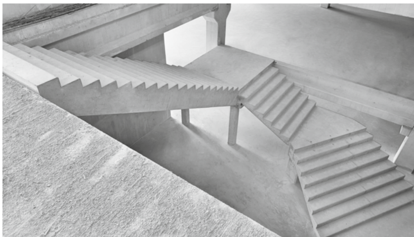
Teknik med nano kan stärka betong.