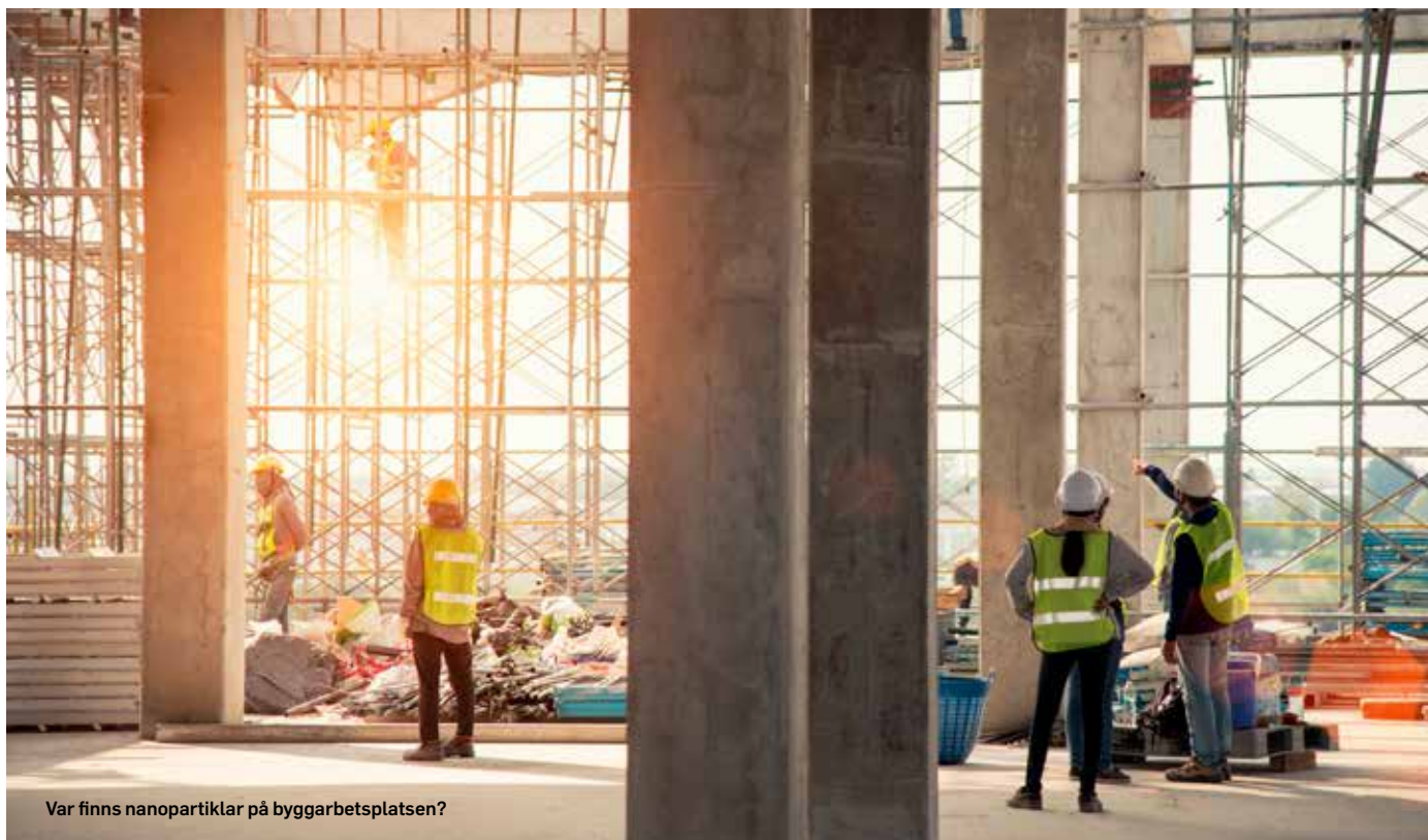
Var finns nanopartiklar på byggarbetsplatsen?

Nanopartiklar med särskilt framtagna egenskaper används allt oftare i byggmaterial. Idag börjar det finnas viss kunskap, även om den är långt ifrån komplett om hur vanliga dessa material är och i vilken utsträckning de påverkar människors hälsa i byggbranschen. Byggsektorn måste därför inta en beredskap för att kunna ifrågasätta nya material kopplade till nanoteknik och kräva kartläggning om eventuella risker.