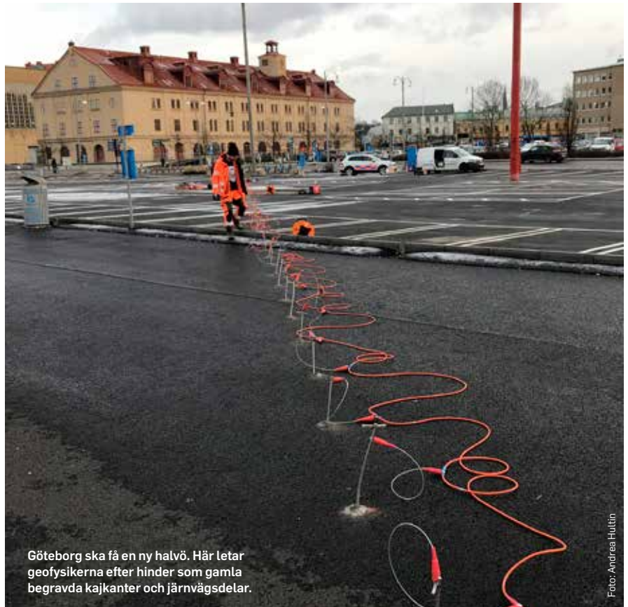
Göteborg ska få en ny halvö. Här letar geofysikerna efter hinder som gamla begravningskajkanter och järnvägsdelar.