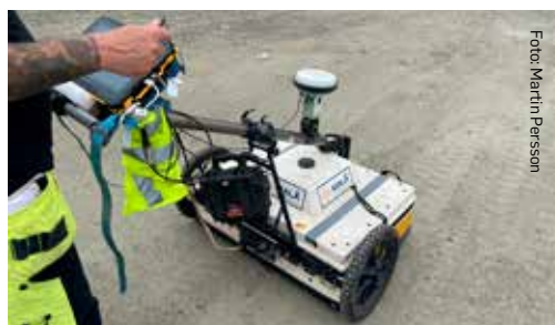
Klassning av marken, med hjälp av georadar, i ett varvsområde som ska exploateras.