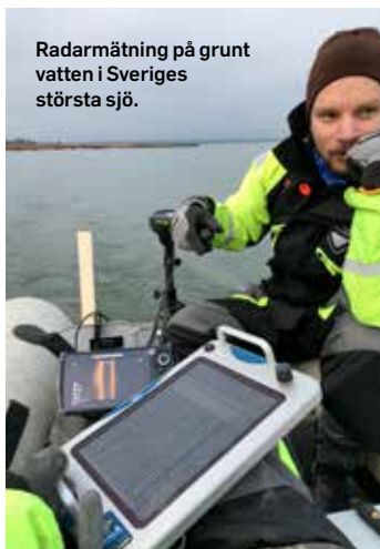
Radarmätning på grunt vatten i Sveriges största sjö.