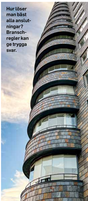
Hur löser man bäst alla anslutningar? Branschregler kan ge trygga svar.