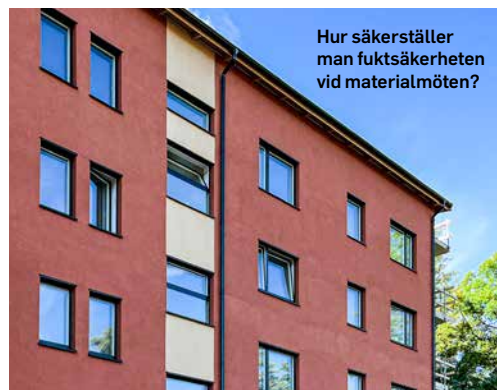
Hur säkerställer man fuktsäkerheten vid materialmöten?

➔ rade och kunskap om befintlig byggnad måste införskaffas och vägas samman med den tänkta åtgärden. Rätt kompetens bland både projektörer och entreprenörer är i vilket fall nödvändig vid både nyproduktion och renovering. Tillämpningen av reglerna är tänkt att vara obligatorisk för samtliga entreprenörersmedlemmar, vilket borgar för säkerhet och kvalitet för beställarna.