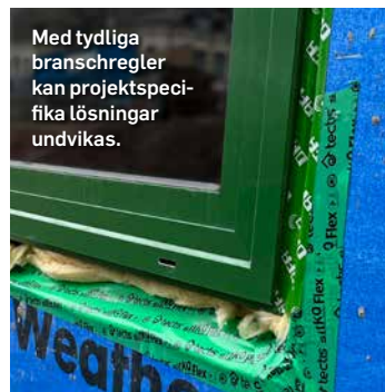
Med tydliga branschregler kan projektspecifika lösningar undvikas.