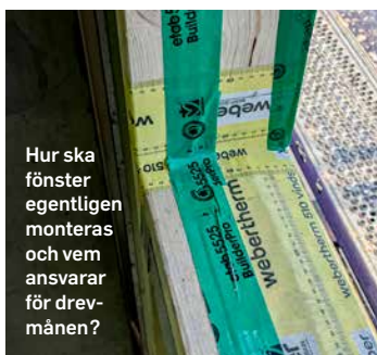
Hur ska fönster egentligen monteras och vem ansvarar för drevmånen?