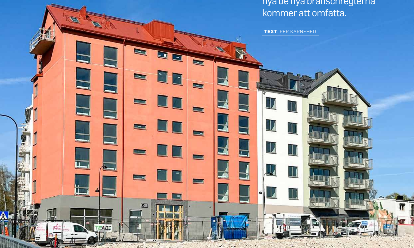
Putsade fasader är klassiskt. Men hur vet man att de fungerar?