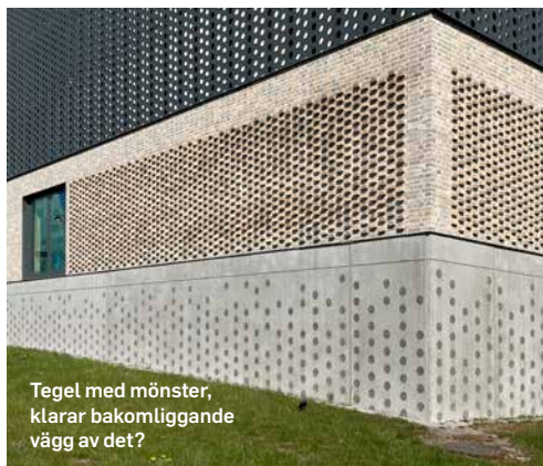
Tegel med mönster, klarar bakomliggande vägg av det?